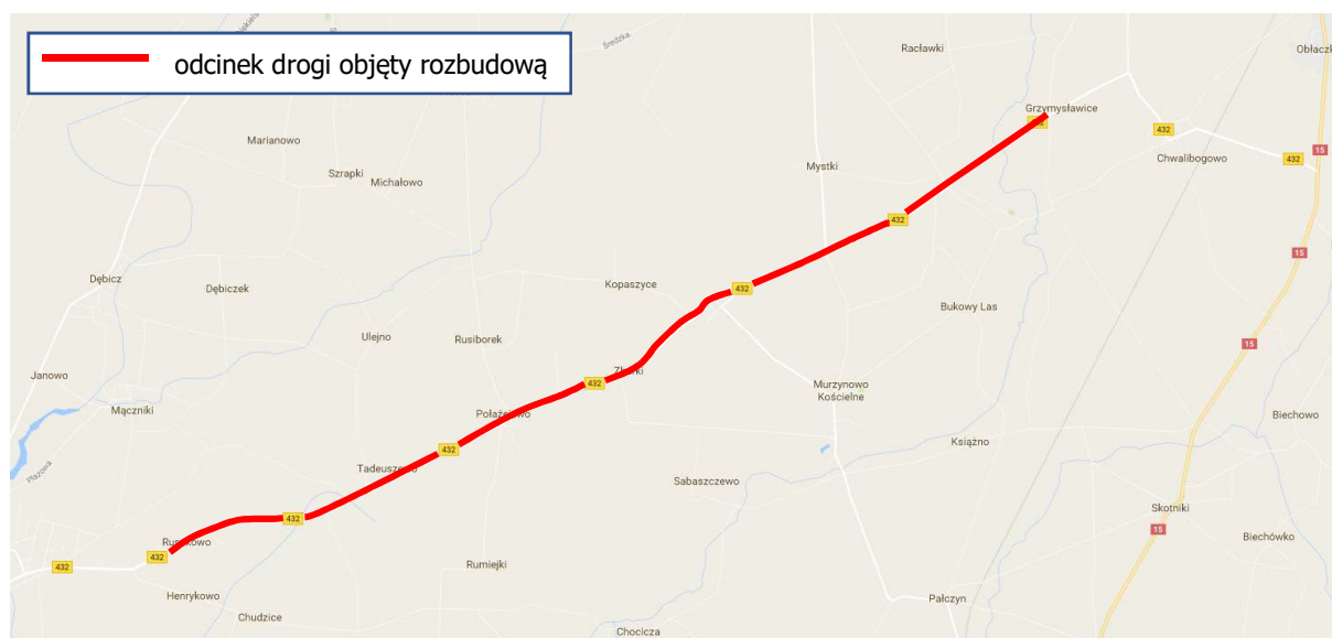
Rysunek: Układ komunikacyjny w rejonie inwestycji